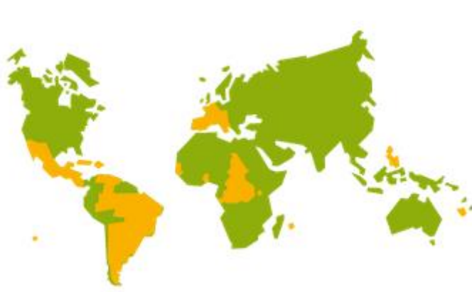
Les MFR dans le monde (dans 30 pays)